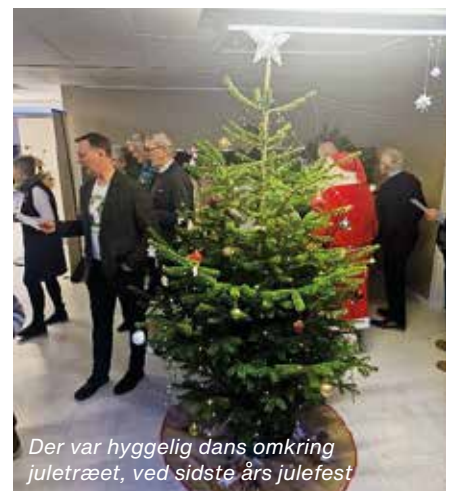
Der var hyggelig dans omkring juletræet, ved sidste års julefest