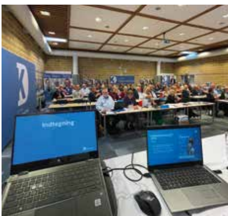
Udsyn over landsmødedeltagerne ved sidste års landsmøde