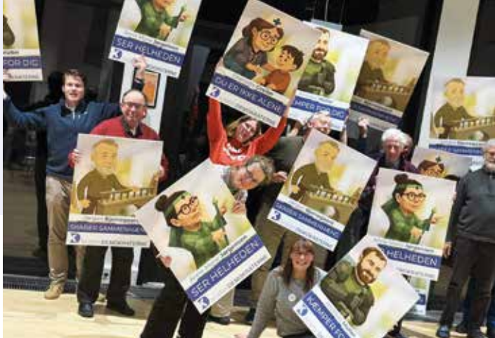
Bestyrelsen samlet med plakaterne fra efterårets valg