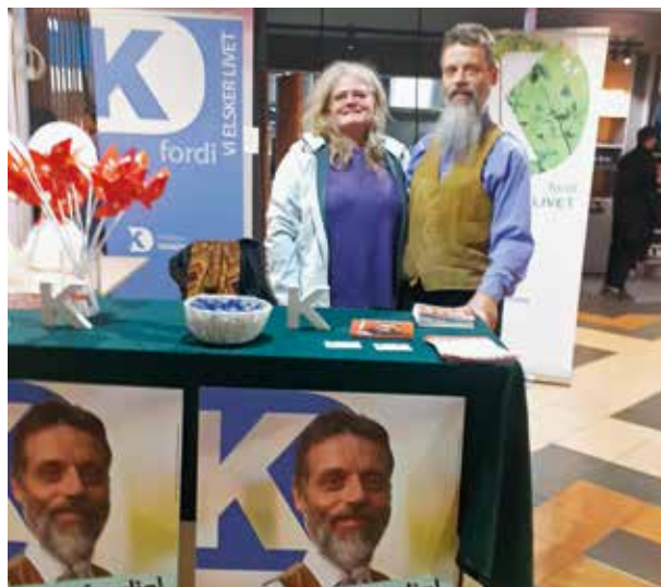
Det blev til mange dages indsats for stemmerne i Rødovre Centrum