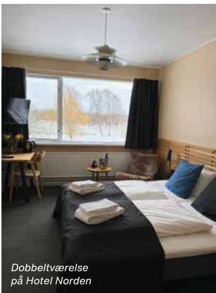
Dobbeltværelse på Hotel Norden