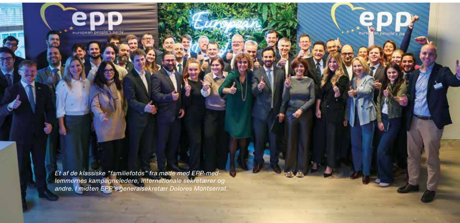
Et af de klassiske "familiefotos" fra møde med EPP-medlemmernes kampagneledere, internationale sekretærer og andre. I midten EPP's generalsekretær Dolores Montserrat.

For KristenDemokraterne giver dette arbejde også en værdifuld mulighed